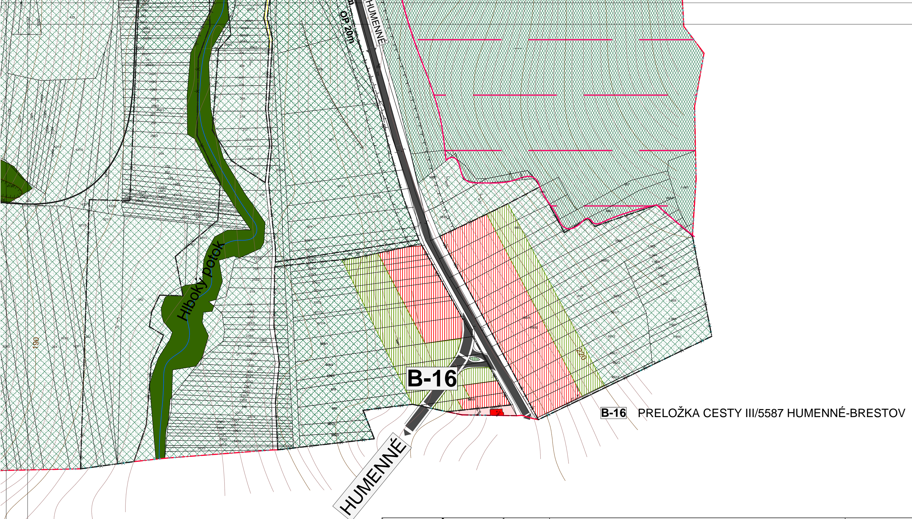
B-16 PRELOŽKA CESTY III/5587 HUMENNÉ-BRESTOV