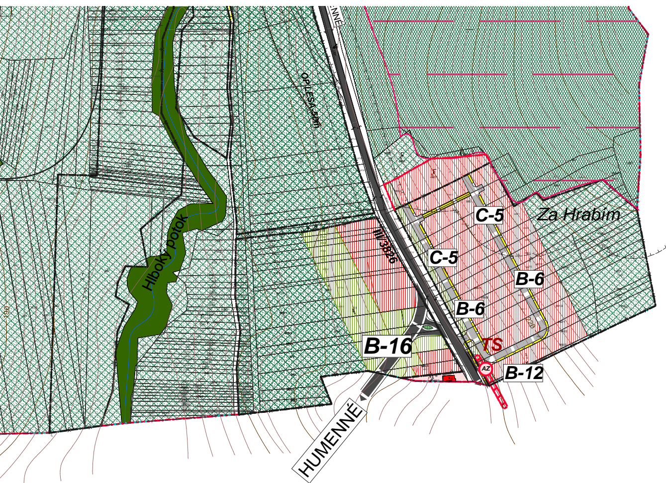
B-16 PRELOŽKA CESTY III/3826 HUMENNÉ-BRESTOV